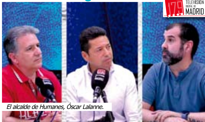
El alcalde de Humanes, Óscar Lalanne.