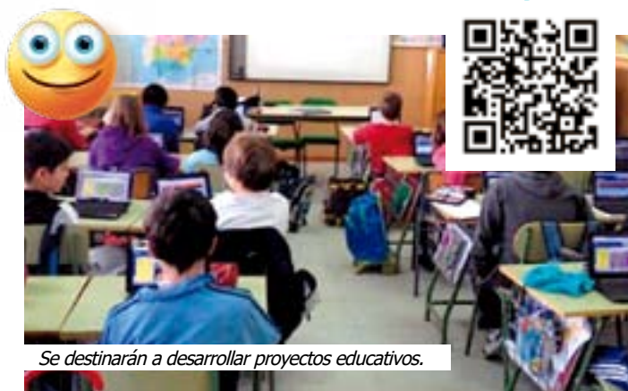
Se destinarán a desarrollar proyectos educativos.

La Junta de Gobierno del Ayuntamiento de Leganés ha aprobado destinar 500.000 euros a subvenciones para proyectos educativos de centros de enseñanza públicos y de AMPAS y Federaciones educativas para el curso 2024-2025. El año pasado se sufragaron un total de 208 proyectos gracias a esta convocatoria de ayudas.