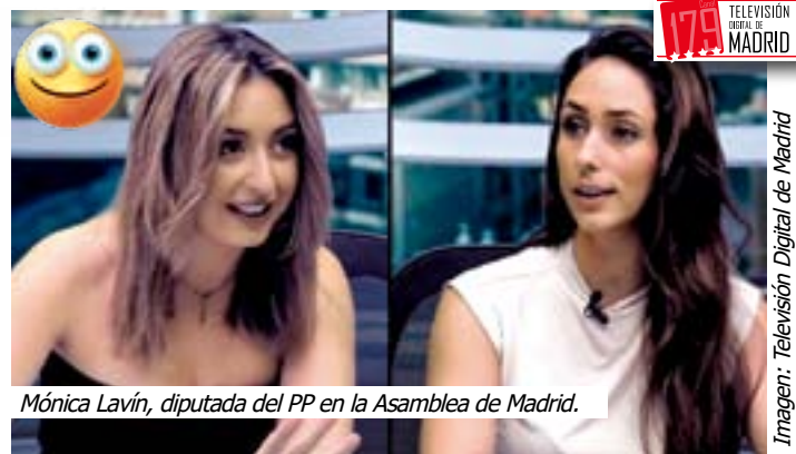
Mónica Lavín, diputada del PP en la Asamblea de Madrid.