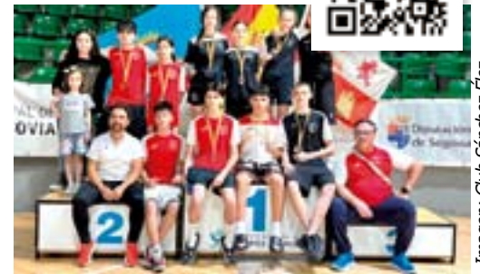
Imagen: Club Sánchez Élez