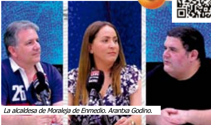
La alcaldesa de Moraleja de Enmedio, Arantxa Godino.