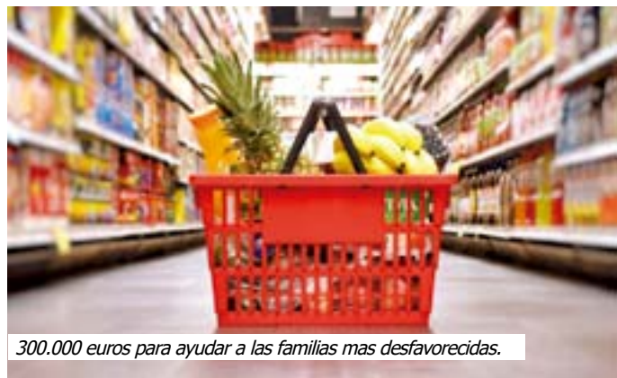
300.000 euros para ayudar a las familias mas desfavorecidas.