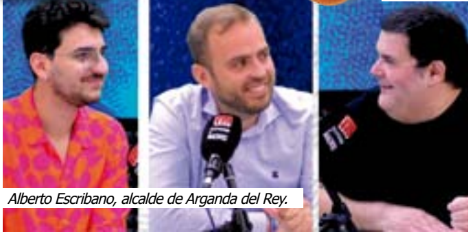
Alberto Escribano, alcalde de Arganda del Rey.