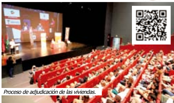
Proceso de adjudicación de las viviendas.