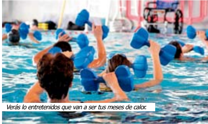
Verás lo entretenidos que van a ser tus meses de calor.

Deporte, cultura, música, excursiones, los meses de verano en Meco prometen dejar un excelente sabor de boca gracias a las numerosas actividades que se ha preparado para todos.