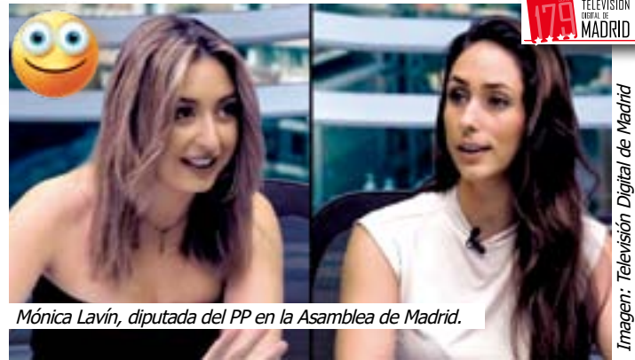
Mónica Lavín, diputada del PP en la Asamblea de Madrid.